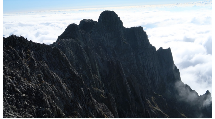
奥穂山頂よりジャンダルム

今年度の山行計画に吊り尾根からパノラマ新道がありましたが、天気悪く中止となったので次回山行の下見ということで行ってきました。3連休初日。6:00沢渡。タクシー乗り合いでスムーズに上高地着。岳沢小屋までは人もまばらで、自分たちのペースで歩けました。それでも岳沢小屋は混雑。これより重太郎新道です。いつも通り休憩をしてもほぼコー