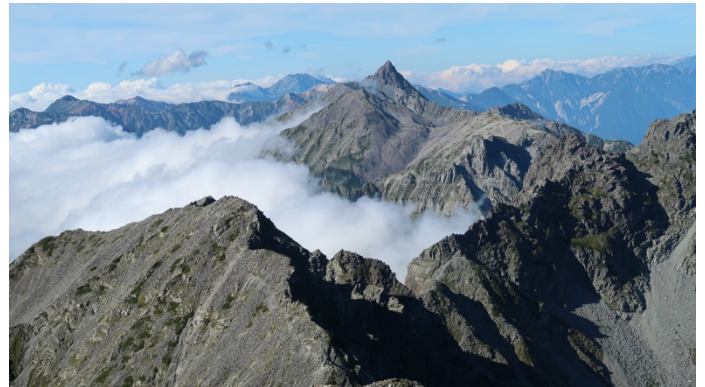
奥穂山頂より槍ヶ岳

スタイムで歩いて行きました。紀美子平で休憩し昼食をとりました。計画では、時間の関係から前穂高岳はパスで直接奥穂へ向かうことにしていました。ところが胃の調子が変わります。食べたものが胃の中に入らない感じ。水分を取っても入らない感じ。吊り尾根では吐きまくってコースタイムの倍の時間がかかってしまいました。ようやく穂高岳山荘について30分ほど座ったところで水分補給したら、胃の中に入っていき、ようやく落ち着くことができました。きっと高山病の症状が出たものと思われます。山荘は滅茶混みで受付に30分かかりました。宿舎は別館で、夕食は20時。テント場も満杯で登山道まであふれていました。